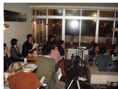
参加者も熱心に聞き入っていました