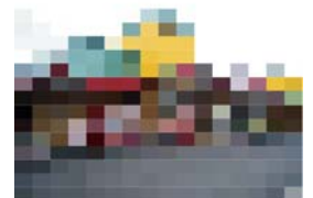
モザイク状にした建築物の例