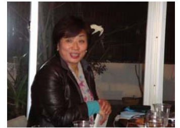
第5回風景デザインサロンの開催です

色彩計画を行うにあたって、地域の景観を良くすることは誰のために行うことか、また、それを誰が守っていくのかをしっかりと認識しなければいけない。行政の力でやっていくことではなかなか対応できることなく、地元住民の人たちが、自分たちの力で守っていくというコンセンサスを得ることがもっとも大切である。そのために、地域の熱意があるところがやりがいがある仕事となる。