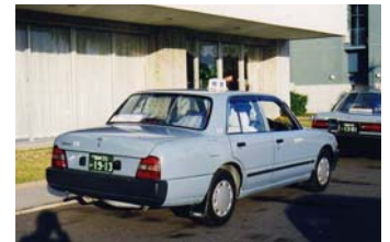
宮崎市のタクシーの色(スカイブルー)